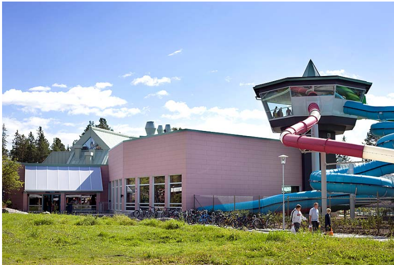
Storsjöbadet i Östersund återinvigdes 4 juli 2008. Moderniseringen av badet har kostat 75 miljoner kronor.