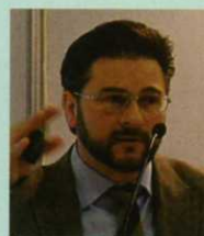
Альберто Апостоли, архитектор (Италия):